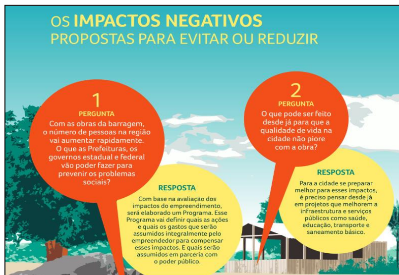
Figura 3 - Cartilha 2 – São Luiz do Tapajós – A Barragem e os Impactos.