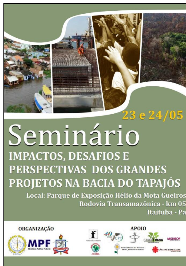
Figura 9 – Folder do Seminário em Itaituba

O segundo evento promovido pelo ministério público, foi realizado nos dias 23 e 24 de maio de 2016 com os mesmos objetivos do primeiro, mas com o intuito de possibilitar a participação de mais pessoas da região (Figura 9).