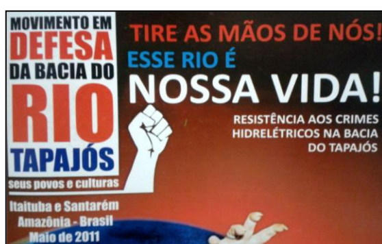
Figura 5 - Cartilha do Movimento Tapajós Vivo.

impactos negativos, dentre outras questões como a crítica ao cadastro socioeconômico feito junto às comunidades, provocando a desarticulação de movimentos locais por gerar insegurança quanto a não realização do cadastro no projeto. Segundo relatado, as pessoas ficaram receosas de não realizarem o cadastro socioeconômico, solicitado pela equipe do Grupo de Estudos, e acabarem ficando de fora de possíveis compensações caso as usinas sejam construídas. Notamos assim uma forte tensão e disputa dentro do campo entre as empresas, representadas pelo Grupo de Estudos e também pela equipe do projeto de comunicação e os movimentos sociais contra a construção das barragens (Figura 5).